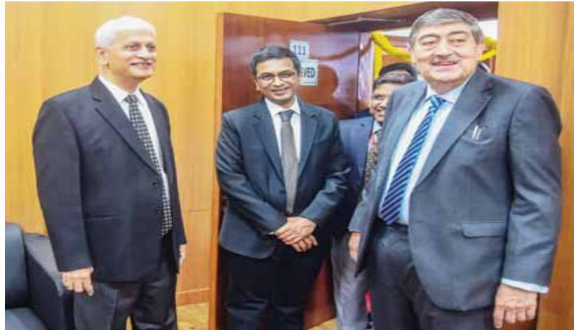
एनएलएसए के नागरिक सेवा केंद्र के उद्घाटन अवसर पर मुख्य न्यायाधीश यूएल ललित व अन्य न्यायाधीश

भारत के प्रधान न्यायाधीश (सीजेआई) यू.एल. ललित ने मंगलवार को यहां जैसलमेर हाउस में राष्ट्रीय विधिक सेवा प्राधिकरण (एनएलएसए) के नागरिक सेवा केंद्र का उद्घाटन किया। सीजेआई उदय उमेश ललित एनएलएसए के प्रमुख संरक्षक हैं। इस अवसर पर न्यायमूर्ति डी वाई चंद्रचूड़, न्यायमूर्ति एस के कौल तथा उच्चतम न्यायालय के अन्य न्यायाधीश भी मौजूद थे। न्यायमूर्ति चंद्रचूड़ एनएलएसए के कार्यकारी अध्यक्ष हैं। सीजेआई ने निशुल्क कानूनी सहायता लाभार्थियों की जरूरतों को पूरा करने की दिशा में कदम आगे बढ़ाने के लिए न्यायमूर्ति चंद्रचूड़ और विधिक सेवा प्राधिकरण के अधिकारियों को बधाई दी। ललित ने कहा कि देश में प्रभावी कानूनी सहायता के वितरण में नागरिक सेवाओं के लिए एक समर्पित केंद्र की स्थापना करना एनएलएसए के लिए एक ऐतिहासिक क्षण है। न्यायमूर्ति चंद्रचूड़ ने कहा कि आम आदमी को बिना किसी परेशानी के प्रभावी कानूनी सेवाएं प्रदान करने के लिए नागरिक सेवा केंद्र एक उत्कृष्ट माध्यम साबित होगा। उन्होंने प्रसन्नता व्यक्त की कि केंद्र एनएलएसए की पहुंच को लोगों तक सुगम बनाएगा क्योंकि यह सभी तकनीकी सुविधाओं से सुसज्जित, आसानी से सुलभ स्थान है।