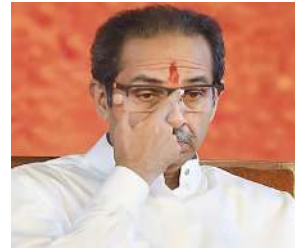
किसी और पद पर हैं।

महाराष्ट्र : उद्धव ठाकरे और एकनाथ शिंदे के बीच चल रही रस्साकशी अब और तेज होने वाली है। दोनों नेताओं के बीच असली शिवसेना के दावे के बाद शिवाजी पार्क दशहरा रैली करने को लेकर खींचतान चल रही है। इस बीच एकनाथ शिंदे गुट ने उद्धव ठाकरे को और कमजोर करने की तैयारी कर ली है। महाराष्ट्र के सियासी हलकों में चर्चा है कि विजयादशमी के मौके पर उद्धव गुट के करीब 15 नेता एकनाथ शिंदे के समर्थन में आ सकते हैं। इन नेताओं में एक सांसद, दो विधायक और लगभग 5 पूर्व पार्षद शामिल हैं। इसके अलावा कुछ और नेता ऐसे हैं, जो विभिन्न निगमों पर पदासीन हैं या